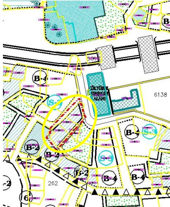
Resim 2: Onaylı 1/1000 Ölçekli Setbaşı – Yeşil - Emirsultan Uygulama İmar Planı

Söz konusu parsel, 1/1000 ölçekli Setbaşı – Yeşil – Emirsultan Uygulama İmar Planı’nda “Sosyal Tesis Alanında” ve Tarihi Kentsel Sit Alanında kalmaktadır.